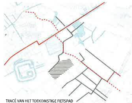
TRACÉ VAN HET TOEKOMSTIGE FIETSPAD

Het nieuw aan te leggen fietspad door Rijvissche (rode stippellijn) zal noordelijk aansluiten op de toekomstige fietssnelweg (volle rode lijn) en ten zuiden zorgen voor een verbinding met het Don Bosocollege. De fietssnelweg op de oude spoorwegbedding is momenteel zo goed als afgewerkt en leidt fietsers via twee bruggen vlot en zonder storend autoverkeer naar de stad Gent of De Pinte. In het kader van de ruilverkaveling Schelde-Leie heeft de Vlaamse Landmaatschappij (VLM) zich verbonden tot aankoop/onteigening van de resterende percelen die nodig zijn om het toekomstige fietspad aan te leggen. Hiervoor wordt een onteigeningsbesluit opgemaakt. Natuurpunt geeft hier ook zijn volle steun aan. In de gebieden die we intussen hebben aangekocht en waar het fietspad doorheen loopt, zal de VLM die stroken van ons overkopen tegen dezelfde prijs die wij hebben betaald.