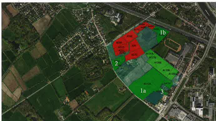
KAART 2 : AANKOPEN IN RIJVISSCHE

Het Gentse stadsontwikkelingsbedrijf SO Gent had in deze zone verscheidene percelen aangekocht voor de realisatie van het wetenschapspark. Als reactie op die plannen ontstond het Hutsepotfront, een samenwerkingsverband met onder andere Actiegroep Bourgoyen-Ossemeersen, een van de voorlopers van Natuurpunt Gent. In 2004 werden de gronden grotendeels bebost door het Hutsepotfront - zo ontstond het Hutsepotbos. Na het schrappen van de plannen voor het Wetenschapspark kon Natuurpunt deze gron-