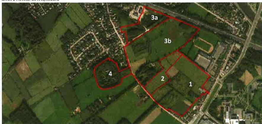
KAART 3: DE DEELGEBIEDEN VAN RIJVISSCHE

den in 2015 aankopen. In het Hutsepotbos vinden we onder andere zomereik, berk, wilg, veldesdoorn, boskers en plataan. De veldesdoorns zijn in lijnverband aangeplant en omzomen het bos (langs de veldwegen). Dwars door het bos, langs de voormalige trambedding, is een platanenrij aangeplant. In het bos zijn nog heel wat grazige, open ruimtes. De gemaaide boszomen vertonen de kenmerken van een glanshavergrasland met aanwezigheid van peen, veldzuring, berenklaauw, boerenwormkruid, Jakobskruid en Canadese guldenroede.