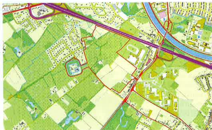
KAART 1: SITUERING RIJVISCHE

Natuurpunt Gent wil samen met de andere Parkbospartners werk maken van de ontwikkeling van Rijvissche, een belangrijk deelgebied van de groenpool Parkbos dat bijkomende kansen biedt voor de natuur en de recreant in de groenpool. De ideeën zijn al een tijdje verzameld, de plannen werden twee jaar geleden goedgekeurd en nu zijn we volop bezig met de realisatie op het terrein. In september 2018 tekenden we opnieuw een aankoopcompromis, deze keer voor ruim 6 hectare. In dit artikel bekijken we ook de andere aankopen in Rijvissche en het burgerbudgetproject.